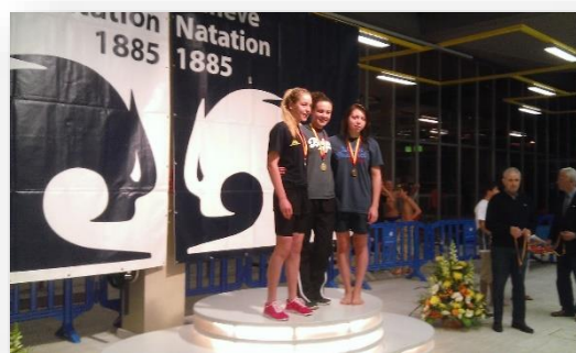
Podium 200 nl