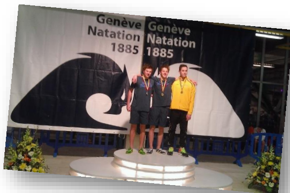
Podium 200 4 n