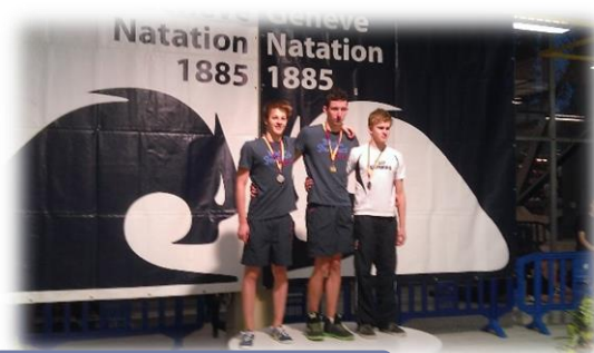
Podium 200 dos

Ci-joint tableaux Excel pour les paramètres de course.