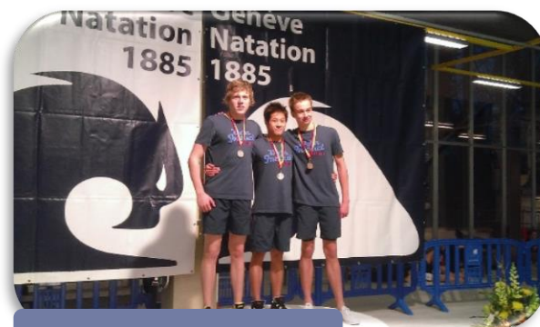
Podium 100 papillon

La majorité des nageurs a égalisé ses performances des Championnats de France minimes ou 16 ans et + et surtout réalisé des meilleures performances individuelles (records régionaux en prime pour certains.) Le niveau de performance est encourageant pour un mois de janvier en vue des Championnats de France à Chartres.