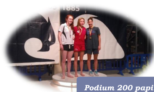
Podium 200 papillon