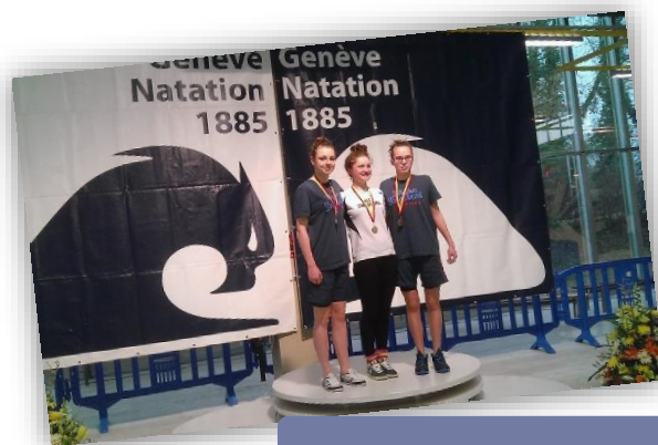
Podium 100 dos