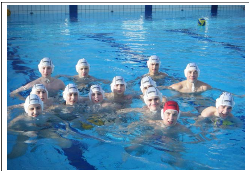
13 joueurs 95-96

Au CREF de LAVAL ( centre régional d'éducation et de formation), en chambre double avec une restauration prise à proximité du CREF