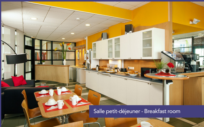
Salle petit-déjeuner - Breakfast room