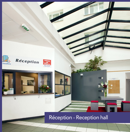
Réception - Reception hall