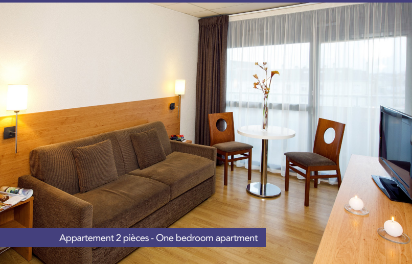
Appartement 2 pièces - One bedroom apartment