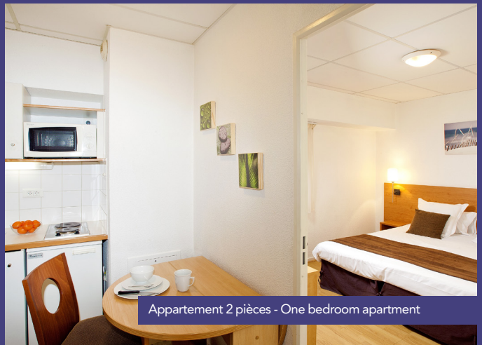
Appartement 2 pièces - One bedroom apartment